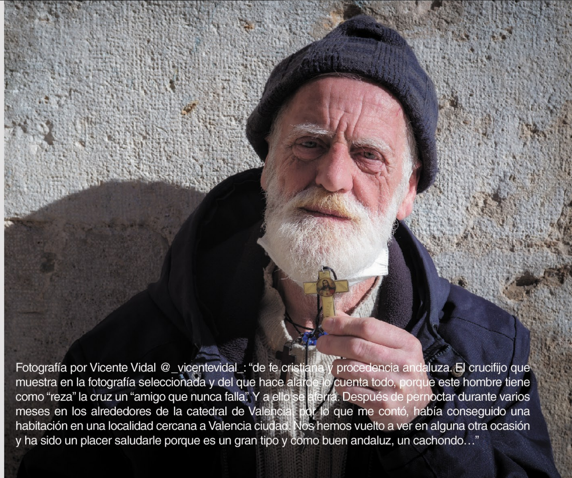
Fotografía por Vicente Vidal @_vicentevidal_: “de fe cristiana y procedencia andaluza. El crucifijo que muestra en la fotografía seleccionada y del que hace alarde lo cuenta todo, porque este hombre tiene como “reza” la cruz un “amigo que nunca falla”. Y a ello se aferra. Después de pernoctar durante varios meses en los alrededores de la catedral de Valencia por lo que me contó, había conseguido una habitación en una localidad cercana a Valencia ciudad. Nos hemos vuelto a ver en alguna otra ocasión y ha sido un placer saludarle porque es un gran tipo y como buen andaluz, un cachondo...”